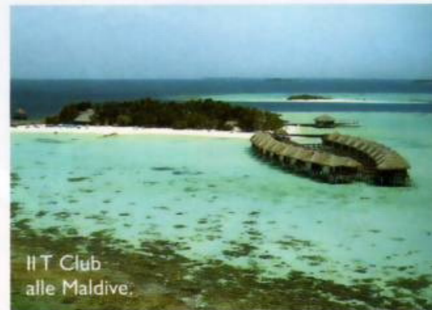
Il T Club alle Maldive.

Perché è verde L'hotel non promuove solo